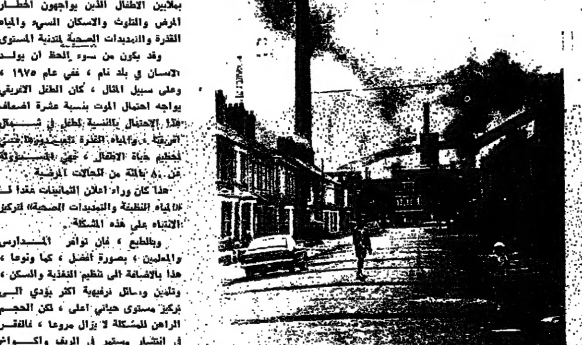
الفازات المتصادمة من وسائط النقل تساعد على تلوث البيئة .

الاضطراب البيئي في عمليات النقل والبناء ، مما يهدد البيئة ، هذا ما لاحظته في بداية الامر ، فالتلوث البيئي ، لا يقتصر على التلوث الهوائي المتطور بحدود اعداد اكبر من الناس وكيات اضعف من التلوث الى التلوث حول العالم . وهذا يبرز مشكلة الموازنة بين مستزلمات النقل والبيئة على السواء ، وفي وقت تتنامى فيه الرغبة ببناء السيارات ، وبالتالي ضخ كيات اضافية من المواد المعادلية للبيئة ، وهذا ما يفرس على الدول ايلد وسائط النقل المعالجة ازيد من الاهتمام ، مع ما يترتب على ذلك من توفير وتأمين لفرس اقتصادية اجتماعية . والقريب «ينص» التقارير الفاتحة بان تكون اكثر هدوءا ، وان تكون العلاقات العملاقة اكثر خفافة .. ثم هناك دول كالحياة بان تكون اقل خطرا بالنسبة للشعوب الذين يعيشون داخل الحصار . وبالمثل فان هذه «المنشآت» تقترن بالقاذورات التي تنتجها التخطيط السري لشركات